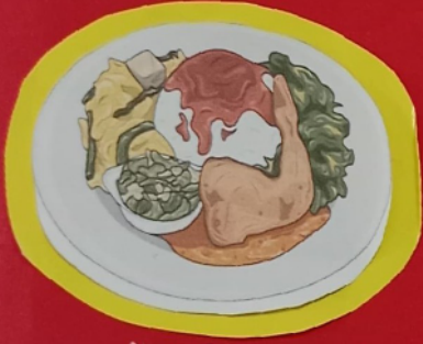
Nasi Padang (Kapau)